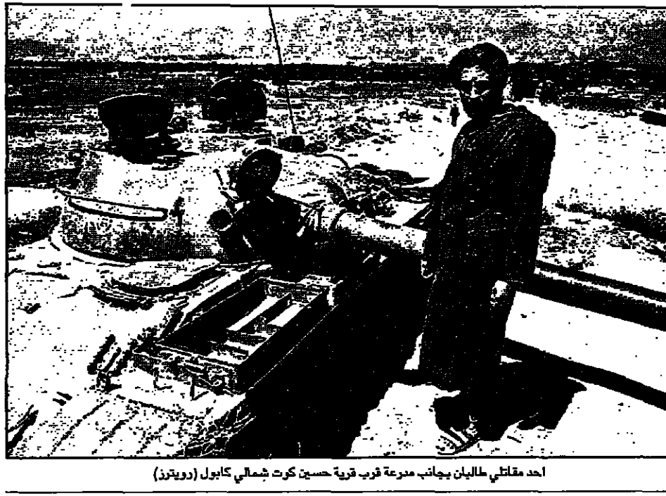
احد مقاتلي طالبان بجانب مرعبة قرب قرية حديد كرت شمالي كابول

وقالت طالبان ايضا انها تتقدم باتجاه المدينة من الشمال الشرقي. وبعد ان استولت على اجزاء من بلدة حيراتران الحدودية الصغيرة المنطقة على قدر يصل بين افغانستان وباكستان. ولكن تم ترد كيديات مستقلة لتزام طالبان بالاستيلاء على مناطق في بلدة حيراتران. وكانت وزارة الدفاع الهندي اتهمته بالهجوم على مزار الشريف في شمال افغانستان بعد ان استولت طالبان الاحد على مدينة شيرخان. وكانت وكالة انباء افغانية مقرها في باكستان قالت ان حركة طالبان الافغانية اسرقت على عاصمة ليلية من تحالف المعارضة الشمالي اسم الثلاثة بعد قتل عتيف ونكث وكالة الانباء الافغانية عن مصادر في افغانستان ان سرى بول الى عاصمة الاقليم الذي يحمل نفس الاسم سقت في ايدي ميليشيا طالبان التي اسرقت نحو 100 مقاتل من تحالف المعارضة. وتقع سرى بول في الجنوب من اقليم جوزجان الذي استولت طالبان على عاصمته شيرخان يوم الاحد. وكانت شيرخان يوم الاحد المعارضة وفتح الاستيلاء عليها الطريق لهزيمة مدينة مزار الشريف اخر مدينة كبرى خارج سيطرة طالبان.